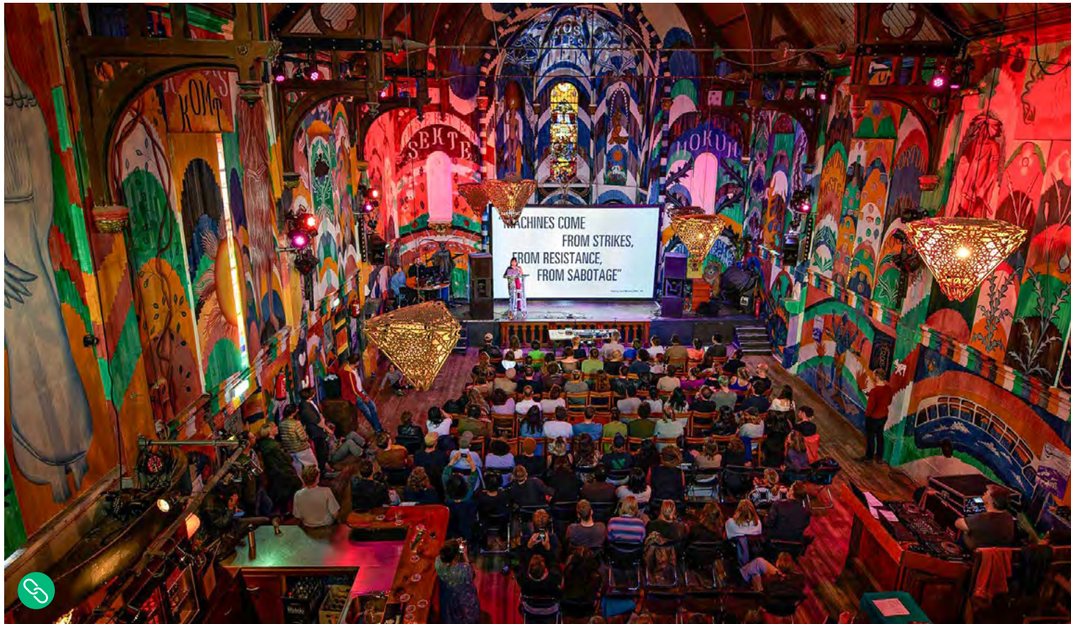
Maritime Fictions by Sonic Acts (2023).

Re-Imagine Europe is een samenwerkingsverband van veertien culturele organisaties in heel Europa, gecoördineerd door Paradiso (NL), geïnitieerd door Sonic Acts (NL) en gerealiseerd in samenwerking met Elevate Festival (AT), INA GRM (FR), A4 (SK), Borealis (NO), KONTEJNER (HR), BEK (NO), RUPERT (LT), Disruption Network Lab (DE), Semibreve (PT), Parco d'Arte Vivente (IT), Kontrapunkt (MK) en Radio Web MACBA (ES).