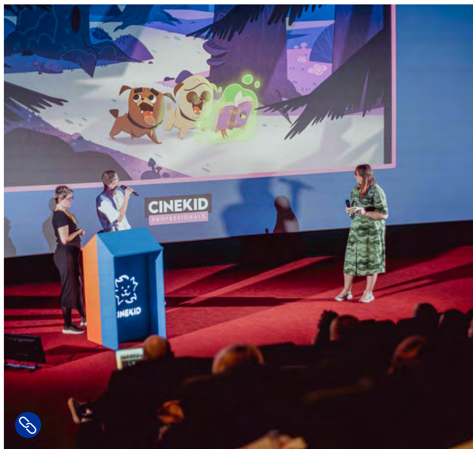
Impressie van de Cinekid Junior Co-production Market