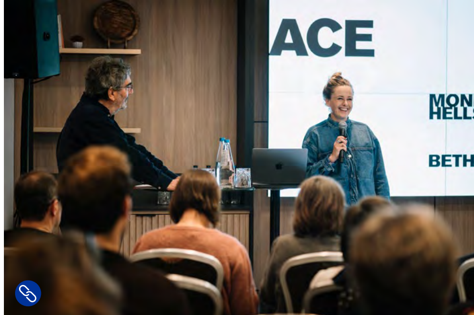
Impressie van een event van ACE Producers

Een aanzienlijk deel van het budget van Creative Europe gaat naar de distributie van Europese films. Alhoewel distributie en vertoning officieel binnen het Business-cluster vallen, benoemen we deze takken apart in deze brochure om meer inzicht te geven in de specifieke geldstromen.