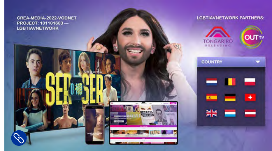
Impression of the project First European LGBTI Network of Film Distribution .

* Het gaat hier om een totaalbedrag voor drie netwerken waar Nederlandse partners in betrokken zijn.